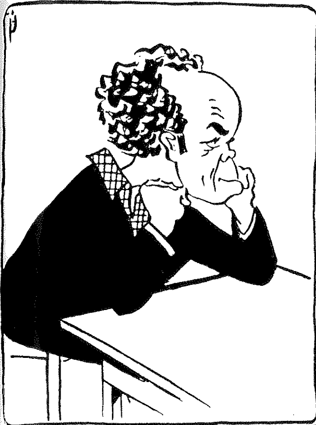
אברהם שלונסקי, "הכהן הגדול" של המוספים לספרות. איור של נח פי

הוותיק והמנוסה ביותר בישראל. התנאי הראשון, לדבריו: "גרעין משתתפים רציני, קבוע ויציב, שראו באכסניה זו את הבמה שלהם"; השני: "חופש ביטוי... שאין לערב שיקולים פוליטיים, אידאולוגיים-מפלגתיים ועסקיים-מסחריים במסגרת מוסף ספרותי. השיקול האחד והיחיד צריך ותייב להיות השיקול הענייני-ספרותי, בחינת הערך הסגולי של החומר המוגש לפרסום... העדרה של צנזורה על דעות ואפילו היו 'אפיקורסיות' ובלתי שגרתיות"; השלישי: "השאפה להבליט את היסוד האקטואלי בספרות ובאמנות... רק ביקורת בעתה עשויה למלא את תפקידה הלוחם והמעודד כאחד"; הרביעי: עידוד יוצרים לפרסם במוסף את "מאמריהם הראשונים" "מכוח עצמם וכשרונם בלבד" ולא "מכוח איזה מפתח-מפלגתי או ותק או 'זכויות' במרכאות ובלעדיהן."